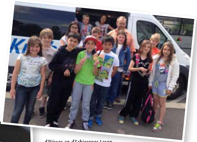
d'Biisser an d'Schierener Lasep zu Stroossen um Schwammfest