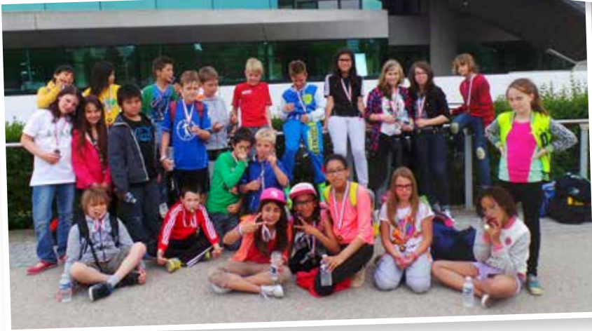
d'Biisser an d'Schierener Lasep um Brevet Sportif an der Coque