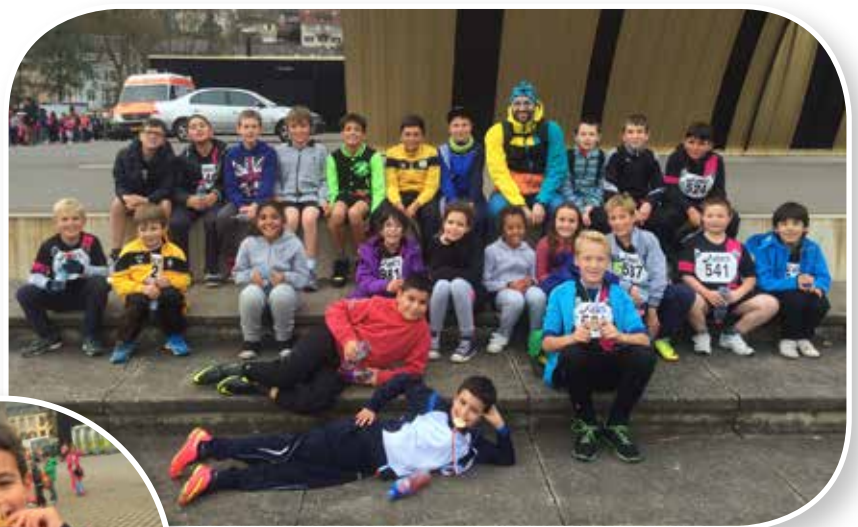
d'Biisser Lasep zu Ettelbréck um Cross National