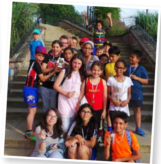
d'Biisser Lasep nom Fussballturnéier zu Kielen

D'Biisser Lasep huet am Schouljoer 2013/2014 un insgesamt 12 Sportsfester deelgeholl. Dobäi koum nach eng Sortie an d'Housener Schwämm, déi mir zesumme mat der Schierener Lasep selwer op d'Been gesat hunn. Insgesamt bei de Sortië waren 173 Kanner derbäi.